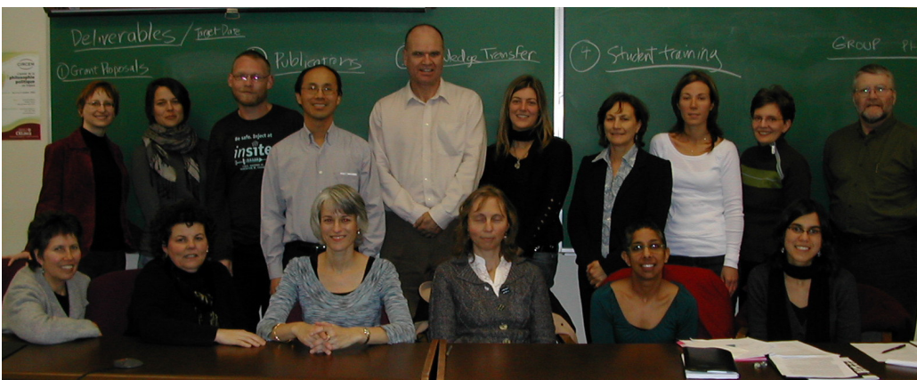
REACH3 members at CRECS, Nov 23, 2007.

Centre for Research on Educational and Community Services at the University of Ottawa. REACH3 members also participated in the annual forum of the Alliance to End Homelessness in Ottawa held at the University of Ottawa on November 22nd, 2007 to mark National Housing Day.